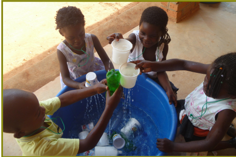
Kinderen spelen in de nieuwe waterbak. Het is een groot succes.

Ons hoofddoel 'goed onderwijs bieden aan de kinderen van Singo en dichte omgeving' hebben we bereikt. De school heeft een stevige basis; letterlijk een diepe, degelijke fundering; maar ook figuurlijk is er een stevige basis gelegd wat het onderwijs betreft. Er is een enorm verschil met 'de school van nu' en 'hoe het toen was in de kerk'. Er wordt geleerd, gespeeld, gezongen, geknutseld