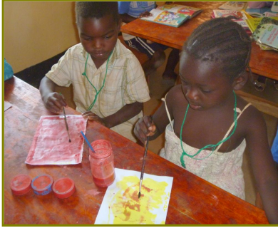
Voor het eerst schilderen

schooltjes van te maken. Via, via is onze hulp al gevraagd en komende week worden de eerste contacten gelegd. Waarschijnlijk kunnen we in de volgende nieuwsbrief meer informatie geven.