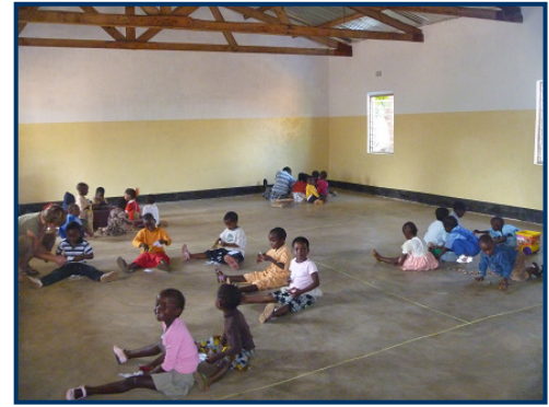
kinderen leren werken in circuit vorm

We verbazen ons er vaak over hoe gewend de kinderen al zijn aan de nieuwe werkwijze en sommige materialen. Ze zijn