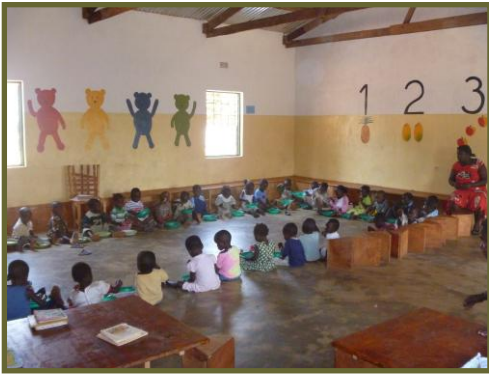
Pap eten in de jongste groep.

gemaakt op de basisschool, en de eerste feedbacks waren heel positief: "De kinderen die van de Arthur nursery school komen doen het erg goed!"